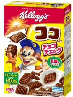
ココくんのチョコチェック

※1 栄養素等表示基準値を100%とした場合/1食分（40g+牛乳200g）の場合