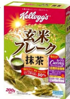
玄米フレーク 抹茶

「 玄米フレーク 抹茶 」は、1984年の発売以来人気のロングセラーである「玄米フレーク」ブランドから昨年2月に発売した季節限定のフレーバー。このたび、大好評にお応えし、また同ブランドの30周年を記念して新発売いたします。牛乳をかければ、1食分で1日に必要な7種のビタミン・鉄分・カルシウムの50%を摂ることができ、※1 毎日を健やかにスタートさせたいシニア世代をはじめ幅広い世代のお客様に手に取っていただきたい製品です。今回は特に健康を意識されるお客様のために、女性だけの30分健康体操教室「カーブス」とコラボレーションしたキャンペーンを実施いたします。