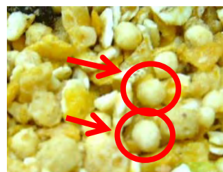
図2)ホワイトクリスプの密度の調節