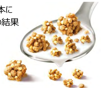
クランチのサイズ（イメージ）

「オールブラン ハニークランチ」のもう一つの特徴は、サクサクの食感が新しいクランチ型。さまざまな素材に蜂蜜を加えてオープンで焼き上げ食べやすい大きさに砕くことで、噛むたびにサクサクした食感と、甘く香ばしい味わいを生み出します。イギリスから日本に持ち込むに当たり、日本のお客様がサクサク感を楽しめる最適なサイズを追求、その結果クランチの一端を、1.7cm以下にすることでこれを実現しました。