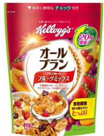
オールブラン フルーツミックス 徳用袋 415g