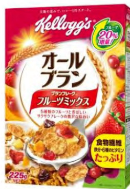
オールブラン フルーツミックス 225g

お客様からの要望にお応えし、415gの徳用サイズは、保存に便利なチャック付スタンディングパウチタイプのパッケージで、新登場いたします。